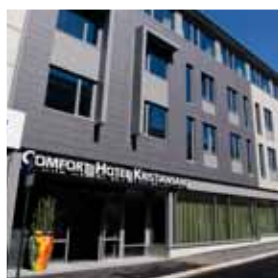
Comfort Hotel Kristiansand