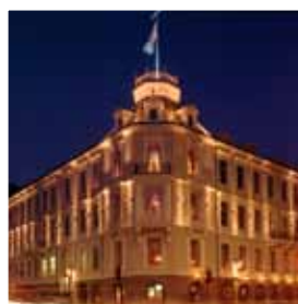
Clarion Hotel Ernst