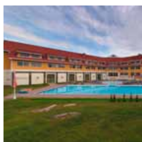
Quality Hotel & Resort Kristiansand