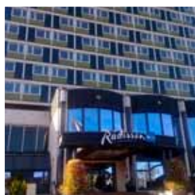
Radisson Blu Caledonien Hotel