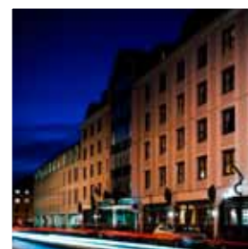
Hotel Norge (Rica Partner Hotel)